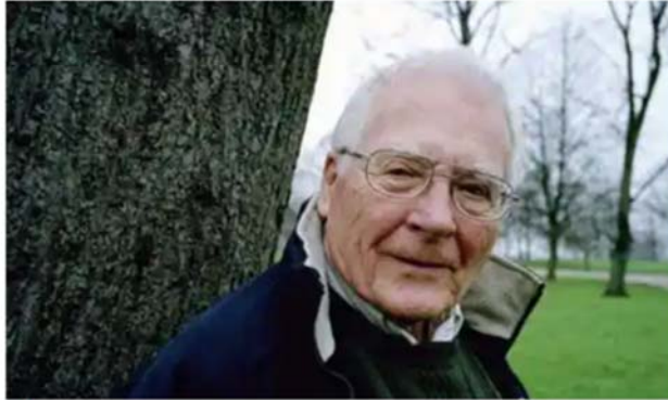
▲ James Lovelock.