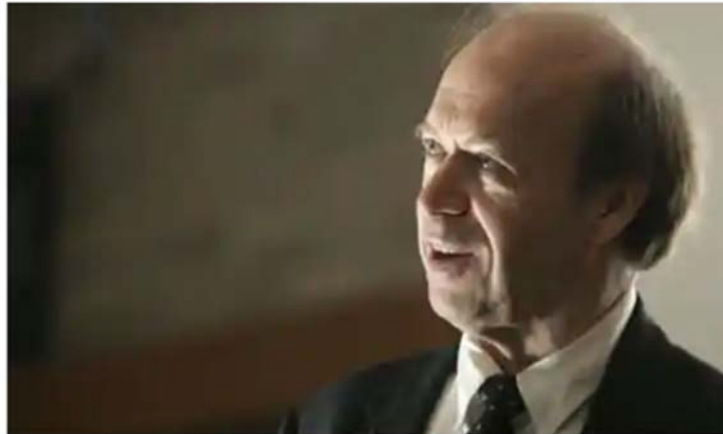
▲ Dr James Hansen.