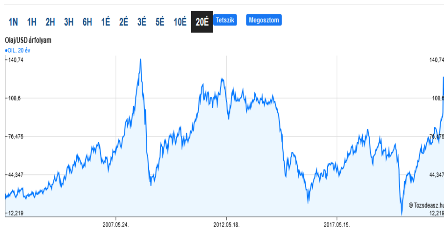
1. ábra. Az olaj világpiacon árfolyama, az elmúlt 20 évben (USD/hordó)

Bevezetéképpen eligazodásul az 1. ábra és a 2. ábra segítségével először bemutatjuk az olaj és a gáz árának az utóbbi két évtizedben való alakulását.