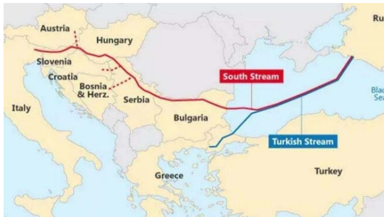
3. ábra. A Déli Áramlat tervezett nyomvonala

Oroszország is már korán felismerte Európa déli irányból való gázellátásának fontosságát. A jelenlegi helyzetben ez ma igazi hosszútávú stratégiai gondolkodásként értékelhető. Ezért Oroszország a Nabucco megbukása után azonnal az ábrán zöld színnel jelölt Déli Áramlat megépítése mellett döntött. Ez a Fekete-tengerbe fektetett vezetékkel Bulgáriában ért volna partot, amint 3. ábrán pontosabban látható.