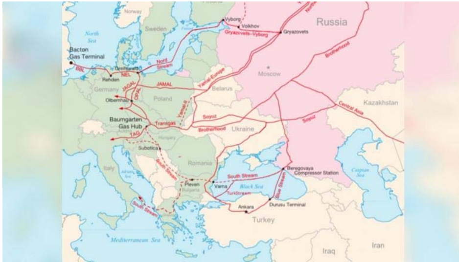
1. ábra. Európa gázellátását szolgáló gázvezetékek

Az EU, amint csappanni kezdtek a nyugati gázforrások, már korán kereste a gázellátás diverzifikálásának lehetőségeit. Ennek szellemében született meg a Nabucco gázvezeték terve, amely a Kászi tenger partjától, Azerbajdzsánból szállított volna nagyobb mennyiségű földgázt ausztriai végponttal. (2. ábra. piros nyomvonal). E projekt a tervezés után leállt. Amikor a beruházási költségeket be kellett volna fizetni a konzorciumnak, a cégek és országok sorra visszaléptek.