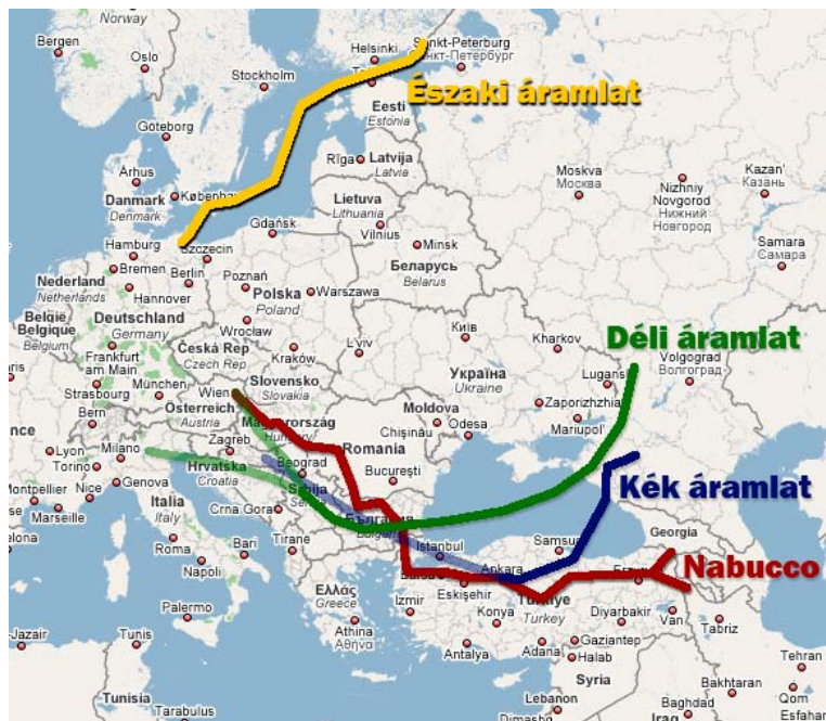
2. ábra. A Nabucco és az azt kiváltó Déli Áramlat

Az EU, amint csappanni kezdtek a nyugati gázforrások, már korán kereste a gázellátás diverzifikálásának lehetőségeit. Ennek szellemében született meg a Nabucco gázvezeték terve, amely a Kászi tenger partjától, Azerbajdzsánból szállított volna nagyobb mennyiségű földgázt ausztriai végponttal. (2. ábra. piros nyomvonal). E projekt a tervezés után leállt. Amikor a beruházási költségeket be kellett volna fizetni a konzorciumnak, a cégek és országok sorra visszaléptek.