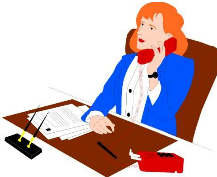
Demmig, felmérés, clip art

Postázta: Andreas Demmig | 2023. szeptember 6. | Energia | 7 |