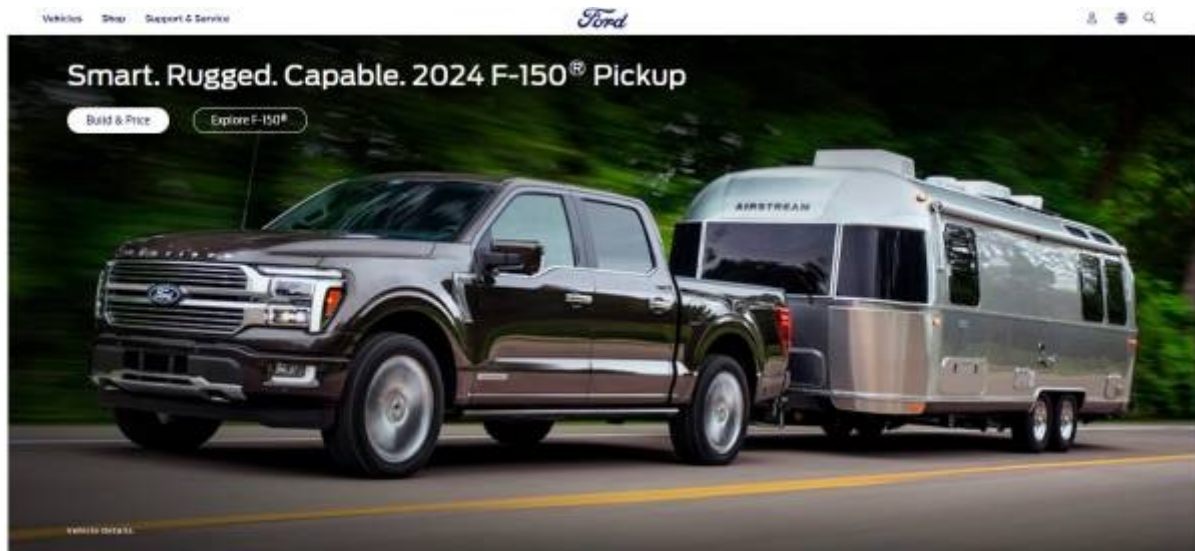
Ford.com - F150-Pickup

Postázta: Andreas Demmig | 2023. szeptember 25. | Energia | 6 |