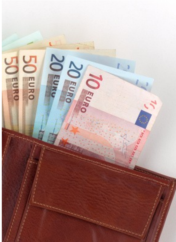
Pénztárca – zsúfolásig tele! A kép forrása: Thommy Weiss / pixelio.de ; ingyenes letöltés 09/19/23