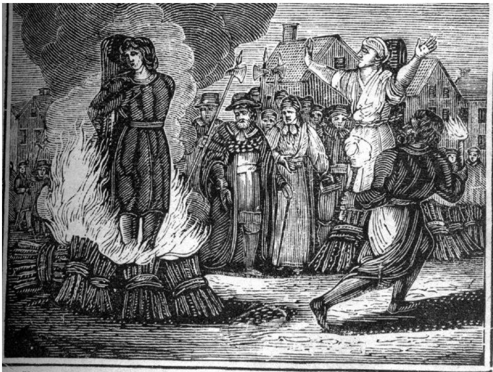
Tárt karokkal az IPCC?

Postázta: Chris Frey | 2023. november 5. | Klíma | 15 |